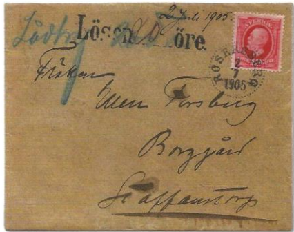
Bild 38. Låt oss anta att mjölkbudet lade avgående brev på brevlådan vid stationen. Då hade postfunktionären inget annat val än att lösenbelägga ett brev som vägrade för mycket. Med noteringen "Lådbref" friskrev han sig från eventuell kritik att ha slarvat vid öppnandet av lösväskan.