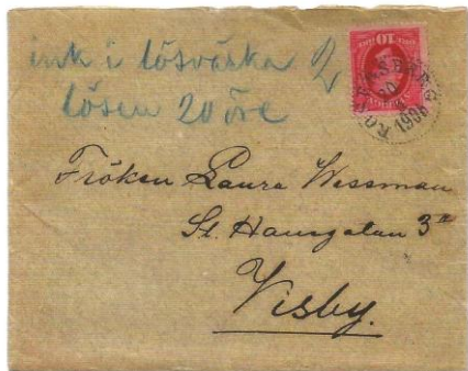
Bild 39. Låt oss anta att mjölkbudet lämnade in väskan till föreståndaren på stationen. Denne kunde ju inte avkräva budet pengar för ett underfrankerat brev som "inkom i lösväskan".

såvida det inte fanns någon värdeförsändelse eller pengar att hantera. Det hände kanske inte så ofta. Det var inget överflöd på kontanter i bondesamhället. Några exempel ur mitt eget samlande kan belysa detta fenomen. (Bilderna 38, 39 och 40.)