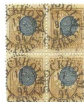
Tydligt förskjutet tryck på En krona med posthorn.

Alla kända stämplade märken av typ I kommer från en utleverans av tio ark (tusen märken) till Malmö daterad den 16.7.1872. Den första tryckleveransen av en riksdaler är daterad den 1.7.1872 och innehöll 18 200 märken (182 ark) och redan dagen efter, den 2.7.1872, följde en ny leverans om 99 100 märken. Samtliga märken i dessa båda är a-nyanser, gulaktigt brun och blå på gulaktigt papper. Mest troligt är retuscheringen av kronorna gjordes redan efter den första lilla tryckningen, annars borde märken från fler orter varit kända.