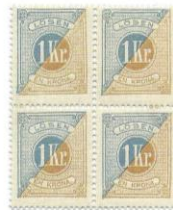
En krona lösen med gradvis förskjutet tryck.

Tryckplåten för det blå mittpartiet med de tre kronorna var sammansatt av 25 block om vardera fyra bilder. En och samma plåt användes för tryckningen av alla enkronor, och även för en riksdaler. De fyra bilderna i respektive 4-block har gemensamma så kallade grundtypsfel (GT), se figur på följande sida) som oftast går att urskilja.