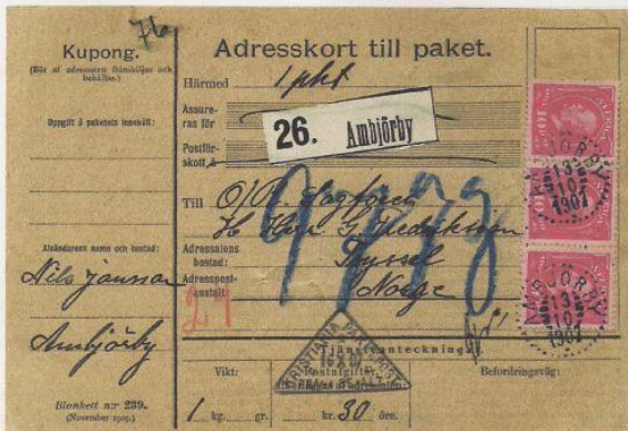
Parcel from Ambjörby, Sweden, to Trysil, October 1907. Kristiania Pakkepost triangular date-stamp with small A