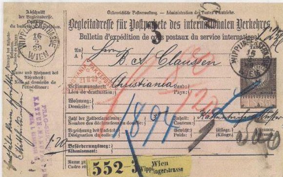
Parcel from Austria to Christiania February 1889 routed via Berlin and Hamburg. Kristiania triangular receiving strike in red

At sometime between 1897 and 1902 the first letter 'A' in Kristiania was replaced with a smaller letter 'A' for reasons not known (see illustration below). A second date-stamp similar to that above but slightly larger and with three closed stars was issued in July 1908. One example is recorded, see illustration on page 53.