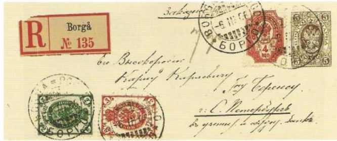
Figure 4.45. The 1889–1890 five kopek stationery envelope was issued in four different sizes and none are believed to have been sold by the Finnish Post. 14 kopeks paid is correct franking for registered first weight letter to Russia, here, Porvoo to St. Petersburg on 6 March 1906. The only 5 kopek stationery envelope listed by Facit as sold by the Finnish Post was not delivered until 13 September 1909. Fagerholm lists one example of the 5 kopek stationery envelope with a Finnish cancellation.