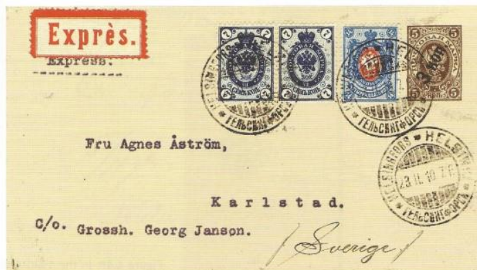
Figure 4.46. This 1909 3/5 overprint stationery envelope Type B is but one of possibly four known with a Finnish cancellation. This "Express" philatelic cover is upfranked with a pair of 7 kopek and a single 14 kopek ring-type stamps. Express service was not recognized from Finland to any foreign destination until after the demonetization of kopek franking.

Het is een meer dan redelijke publicatie over de filatelistische achtergronden van een voor veel verzamelaars onbekende en duistere periode geworden. Een boek die de serieuze Finland verzamelaar in de boekenkast zou moeten staan en gelezen dient te worden.