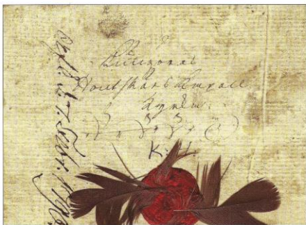
1790 – 27. Januar, Jarva nach Hontskår via Korpo