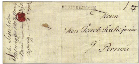
1767 – 19. März, Helsingfors via Abborfors - St. Petersburg (2. Type 1767-72) - Narva nach Pernau; Ankunft: 11. Januar 1767

Gebühr: bis Abborfors – 3 Öre (Tarif: 17. März 1747) = 12 Kop. + 15 Kop. für die russische Strecke bis Pernau – vom Empfänger zu entrichten – 27 Kop.