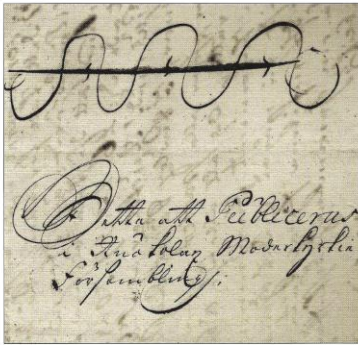
1723 – drei Kronen – 11. Juli, Verkündigungsschreiben aus Helsingfors nach Ruokolax Höher gestellte Persönlichkeiten hatten die Befugnis, Briefe von besonderer Dringlichkeit mit bis zu drei Federn unter ihrem Siegel zu versehen, je nach der Wichtigkeit ihres Amtes oder der Nachricht.

door de vrije schrijfstijl, absoluut geen straf is. Tegen de serieuze Finland verzamelaar, en zeker gezien de aanschafprijs, zou ik zeggen, snel aanschaffen!