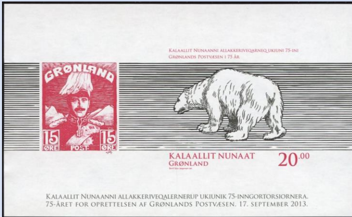
Fig. 1 De ongetande versie van het velletje 75 jaar Groenlands postwezen.

Tijdens de postzegel- brief en briefkaart beurs in Frederiksberg Kopenhagen heeft de Groenlandse post een speciaal ongetand souvenir velletje uitgegeven, dat eerder alleen getand verkrijgbaar was.