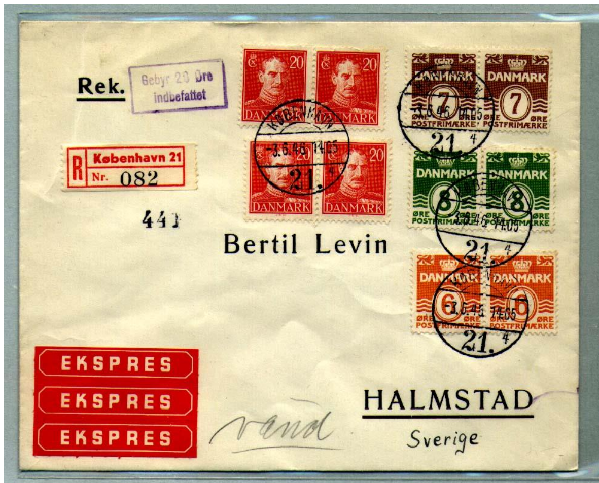
Afbeelding 7. Een aangetekende Expresse brief verzonden van Kopenhagen (21 4 ), 3-6-46, naar Halmstad, Zweden. Voor de aanname en inschrijving van dit stuk was 20 øre Gebyr verschuldigd.

Ik kan nog wel enige tarieven die toentertijd golden vermelden.