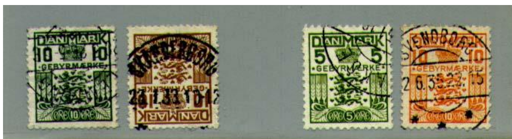
Afbeelding 9. De vier definitieve 'Gebyr' zegels.

Gedurende de periode van de Gebyr-zegels werden er slechts 5 zegels uitgegeven. In 1923 een met het woord Gebyr overdrukte 10 øre portzegel. In 1926 een groen zegel van 10 øre en in 1930 nogmaals een bruin 10 øre zegel. Beiden waren gedrukt in staaldruk. In 1934 werden er in boekdruk nog eens een groene 5 øre en een oranje 10 øre zegel uitgebracht.