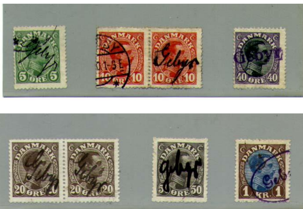
Afbeelding 4. Enkele losse zegels en paartjes, alle gewone postzegels met het met de hand (pen of stempel) aangebrachte woord "GEBYR".

"Dienstbijslagzegels werden op bepaalde postkantoren gebruikt als betaalbewijs - of reçu - voor de speciale diensten die verleend werden bij aangetekende stukken enzovoorts, die aangeleverd werden buiten de normale kantooruren. Op sommige van de kleinere postkantoren werden in plaats van de GEBYR-zegels gewone postzegels gebruikt die, voorzien werden van het woord GEBYR. Dit kon met de hand over het zegel geschreven worden of door middel van een rubberstempel."