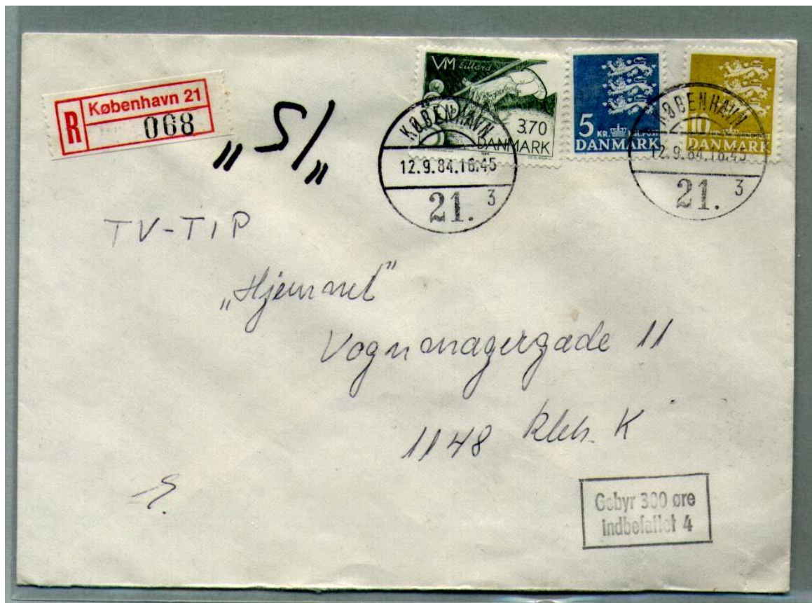
Afbeelding 8. Een aangetekende brief verzonden binnen Kopenhagen (21 3 ), 12-9-84. Het binnenland tarief voor een brief tot 20 gram was op dat moment 270 øre. Het aantekenrecht bedroeg 1300 øre. Het 'Gebyr' bedroeg 300 øre. Totaal 1870 øre.

Gedurende de periode van de Gebyr-zegels werden er slechts 5 zegels uitgegeven. In 1923 een met het woord Gebyr overdrukte 10 øre portzegel. In 1926 een groen zegel van 10 øre en in 1930 nogmaals een bruin 10 øre zegel. Beiden waren gedrukt in staaldruk. In 1934 werden er in boekdruk nog eens een groene 5 øre en een oranje 10 øre zegel uitgebracht.