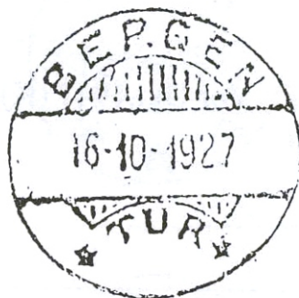
TUR-stempel met maandaanduiding met Arabische cijfers. Het werd gebruikt tussen 1902 en 1941. In de lijst bij het artikel wordt het type 4 genoemd. Het heeft 13 verticale strepen in het bovenste deel van het stempel.

Een ander tussenartikel vertelt over de TUR-stempel.