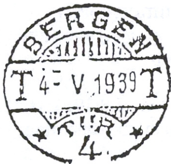
Her TUR-stempel, zoals gebruikt op de getoonde prentbriefkaart, met maandaanduiding met Romeinse cijfer.