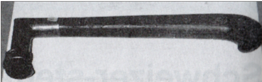
Een grappig tussenartikel verhaalt van een in het Noors genoemd 'Hammer-stempler'. Een werktuig met een lange handvat, met op het einde van dat handvat een stempelblok. Het artikel vertelt, dat dit apparaat in 1902 wed uitgeprobeerd, maar uiteindelijk afgekeurd, omdat de stempelkwaliteit niet goed genoeg werd bevonden. Het grappige van dit verhaal is, dat ik eind jaren zestig van de vorige eeuw vakantiewerk deed tijdens de kestvakanatie en hele dagen kerstpost heb staan afstempelen met ditzelfde stempelapparaat. Achter op de hamersteel zat een verdikking, die ervoor zorgde, dat de hamer goed in je hand lag en je in een lekker ritme kon stempelen. Achteraf een bezigheid met een lange historie.