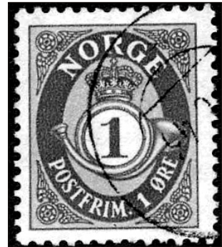
NK 197: Posthoorn. Diepdruk. 1937.

In 1937 begonnen met het drukken van postzegels bij de firma Emil Moestue in diepdruk. Het artikel behandelt uitvoerig de verschillende drukken, papiersoorten en gomvarianties, alsmede