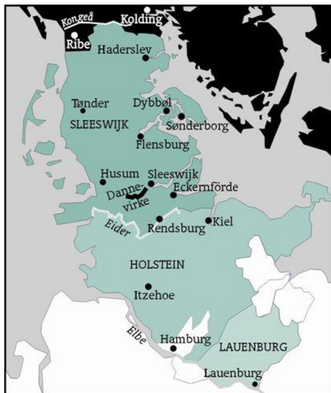
Afbeelding 1. Landkaartje met de Hertogdommen.

De toenmalige vrije, Hanzesteden Hamburg en Lübeck hadden al sinds lange tijd nauwe banden met het Deense rijk. Deze twee steden en Oldenburg vielen niet onder het Deense postale stelsel maar er waren wel Deense postkantoren gevestigd.