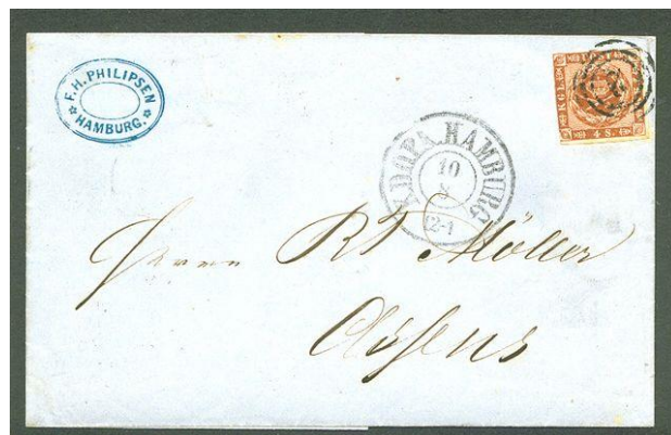
Afbeelding 7. Nummerstempel 2, Hamburg, op brief.

en Lübeck. Nr. 4 ging naar Aalborg, 5 naar Aarhus en zo door tot 79 Wyck en 80 het kantoor in Æroskjøbing. De nummers 81 t/m 112 gingen naar de bijkantoren in Denemarken en Sleeswijk.