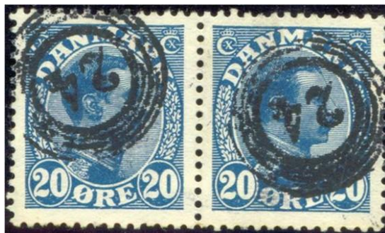
Afbeelding 13. AFA 71 met nummer 24.

De verzamelaar die zich met deze stempels wil gaan bezighouden doet er goed aan om te beginnen met een basisverzameling van alle nummers en, zo hij of zij wil, de verschillende cijfertypen daarin op te nemen. Na verloop van tijd is een specialisatie binnen deze verzameling