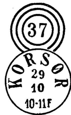
Afbeelding 6. Nummer combinatiestempel.