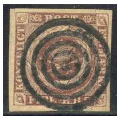
Afbeelding 4. Een zegel met een bijna perfect in het midden geplaatst stempel.

De nieuwe reglementen (15-04-1851) schreven voor dat bij het plaatsen van het stempel zo veel mogelijk van het zegelbeeld moest worden bedekt. Als we kijken naar het formaat van het gebruikte zegel zult u zien dat een perfect geplaatst stempel precies binnen het zegelbeeld viel, met als gevolg dat er weinig tot geen stempelinkt op de brief zelf terecht kwam. Daar alle stempels uniform waren was het niet mogelijk om te zien op welk kantoor het vernietigingsstempel geplaatst was. Hierdoor was de mogelijkheid tot fraude, ditmaal door oneerlijke postbeambten, nog steeds aanwezig. Een eerder gebruikt zegel waarbij het stempel dus geheel binnen het zegelbeeld viel, kon door een frauduleuze postbeambte een tweede maal op een brief geplakt worden waarbij het zojuist betaalde porto in eigen zak gestoken werd. Terwijl bij een stempel dat op zowel het zegel als op de brief was geplaatst het zegel als het ware aan de brief was “verbonden”.