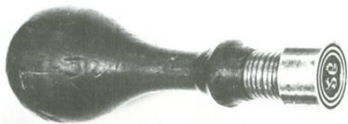
Afbeelding 3. Hand-nummerstempel.

Deze stempels waren in geen geval uniform aan elkaar. Er bestonden diverse variaties in diameters. De buitendiameter van deze stempels bedroeg tussen de 17 en 19,5 mm en de binnenste ring had een doorsnee die varieerde van 4 tot 6½ mm. Ook de punt in het midden kon een dikke of een dunne punt zijn. Bij het stempel dat bestond uit drie ringen was de binnenste ring 11mm in doorsnee. Deze “stomme” stempels werden, op een enkele uitzondering na, samen met de eerste zegels op 1 april 1852 aan de postkantoren verstrekt. Deze stomme stempels bestonden, evenals hun genummerde opvolgers, uit een in staal of messing gegraveerde stempelkop dat door middel van schroefdraad aan een houten handvat werd bevestigd.