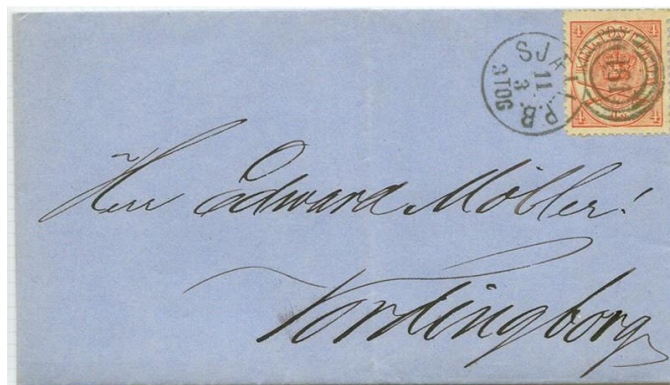
Afbeelding 11. Duplexstempel nummer 181.

Doordat er volgens de officiële regels per brief twee keer gestempeld moest worden en niet overal genoeg duplex stempels voorhanden waren werd er nog wel eens, dit geheel tegen de regels in, een datumstempel gebruikt ter vernietiging van het zegel. De grotere kantoren, Kopenhagen, Aarhus en Aalborg bezondigden zich, al sinds 1870, hier regelmatig aan. Poststukken uit deze periode zonder een nummerstempel zijn regelmatig op veilingen te vinden.