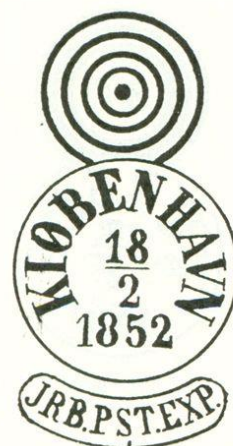
Afbeelding 5. Stom combinatiestempel.

Door het gebruik van twee verschillende stempels, het vertrek- en het vernietigingsstempel, werd de werkdruk, zeker op postkantoren waar veel post verwerkt werd, navenant groter. Op het Kopenhaagse stationspostkantoor werd hierop een oplossing gevonden door het vervaardigen van een gecombineerd stempel. Hierbij werden een stom stempel en een datumstempel aan elkaar bevestigd waardoor er bij één stempel slag het ring gedeelte het zegel ontwaarde en het datumstempel onder het zegel, in de praktijk vaak naast het zegel, de nodige informatie verstreekte. Later kwamen er ook combi- of duplexstempels met nummers in het ringsegment in gebruik.