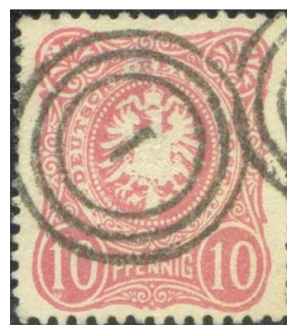
Afbeelding 14. Kopenhagen nummer 1 op Duits zegel.

niet uit te sluiten. Men kan dan denken aan bijvoorbeeld een speciaal geografisch gebied, een eiland, landstreek of een van de Hertogdommen, ook rijdende postkantoren of postwagons met hun specifieke routes kunnen een aardige verzameling opleveren. Uiteraard geeft het onderbrengen van een aantal brieven een extra cachet aan een verzameling Deense nummertempels.