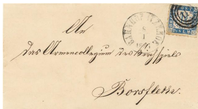
Afbeelding 8. Nummerstempel 119 (Itzehoe) gebruikt in 1861 op een Deens zegel en op een zegel van Lauenborg in 1865.

Na de vrede van Wenen (30 oktober 1864) moest Denemarken officieel afstand doen van de drie Hertogdommen. Dit betekende een enorme aderlating waardoor een kleine 20.000 km 2 land met pakweg 700.000 inwoners aan de Deense economie werd onttrokken. Na de Oostenrijks-Pruisische oorlog kwamen al deze gebieden onder Pruisisch gezag en was de Oostenrijkse rol in dit gebied uitgespeeld. Tijdens de vrede van Praag, augustus 1866, waar Oostenrijk definitief door de Pruisen buitenspel werden gezet, werd er aan de bevolking van de Hertogdommen nog wel een plebisciet, een volksstemming, beloofd maar daar kwam uiteindelijk niets meer van.