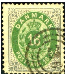
Afbeelding 10. Nummerstempel 236, Reykjavik.

In maart 1870 kregen twee IJslandse kantoren, Reykjavík en Seidisfjörður, de nummers 236 en 237 toegewezen.