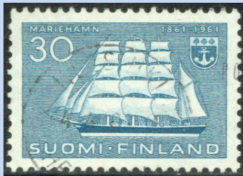
Afbeelding 6. (De viermaster "Pommeren" en het wapen van Mariehamn op een Fins zegel uit 1961 ter gelegenheid van het eeuwfeest van deze stad)