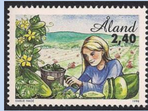
Afbeelding 9. (De landbouw waaronder uitgestrekte vruchtboomgaarden -hier een appel boomgaard en een augurken/komkommer plukkende dame- heeft dankzij het gunstige klimaat een bloeiend bestaan)

Dat de autonome status van de eilanden uiteindelijk resulteerde in het uitgeven van eigen postzegels heeft de financiële status van Åland ook economisch gezien geen windeieren gelegd. Deze eerste zegels zagen het daglicht op 1 maart 1984. De eerste serie omvatte een set van zes zegels met afbeeldingen van een zeilboot zoals in gebruik bij de vissers van Eckerö, een landkaart met de eilanden en een afbeelding van het zegel van de Heilige Olaf, Olof of "Olav den Hellige" zoals de Denen hem noemden. Deze Olof was een Noorse koning die, gevlucht voor de Denen, een tijdlang zijn heil in Rusland, Finland en op de eilanden heeft gezocht.