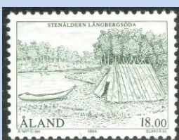
Afbeelding 3. (Een gereconstrueerde woonplaats van de vroegere bewoners van het Ålandse Långbergsöda (Saltvik) te zien in het openluchtmuseum aldaar)

Deze eilanden die vroeger een strategisch tussenstation waren voor de oorlogs- en handelsschepen van o.a. de Vikingen maar later ook een logische verbinding voor de postroute tussen Zweden en Finland vormden, hebben een turbulente geschiedenis achter de rug. Hierbij waren ze soms als een speelbal tussen de diverse (groot)machten die in dit gebied hun (handels)belangen wilden vestigen, uitbreiden en/of behouden. Hoewel de eilanden pakweg 6000 jaar terug al bewoond werden door varende en vissende stammen werden ze later door de Vikingen herontdekt en gebruikt als woon- en rustplaats.