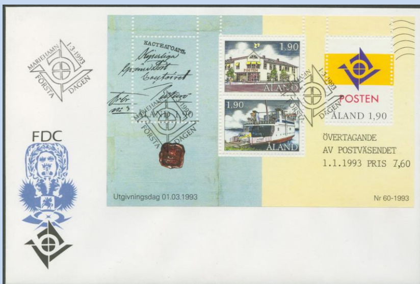
Afbeelding 11. (Een FDC met het herinneringsvelletje dat uitgegeven werd op 1 maart ter herinnering aan deze gebeurtenis)

Op 1 januari 1993 kregen de eilanden nog meer zeggenschap over hun eilanden en werd o.a. de onafhankelijke Ålandse postdienst een feit.