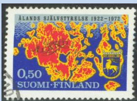
Afbeelding 2. (50 jaar zelf bestuur op Åland -1922/1972)

Een van de jongste loten aan de Scandinavische filatelistische boom is een groep eilanden tussen Finland en Zweden. Deze groep bestaat uit meer dan 20.000 eilanden, eilandjes en uit zee oprijzende grote en kleine rotsblokken. "Slechts" 6800 hiervan hebben het predicaat eiland verdiend. Met een totale oppervlakte van net iets minder dan 1500 km 2 en gesitueerd in het zuidelijke deel van de Botnische golf tussen Zweden en Finland heeft het een strategische ligging. Het geheel heet Ahvenanmaa althans in het Fins. De meest gangbare en gebruikte naam is de Zweedse benaming, namelijk Åland. Van deze 6800 eilanden zijn er niet meer dan een stuk of honderd bewoond. Het grootste eiland heet Åland