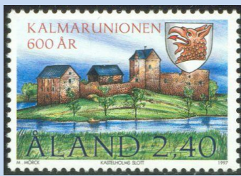
Afbeelding 5. (Kasteel "Kastelholm" was het kasteel van de Deense Koningin Margareta. Zij was de drijvende kracht achter de Unie van Kalmar, de vereniging van Noorwegen Zweden en Denemarken. Deze Unie werd in 1397 in het Zweedse Kalmar opgericht)