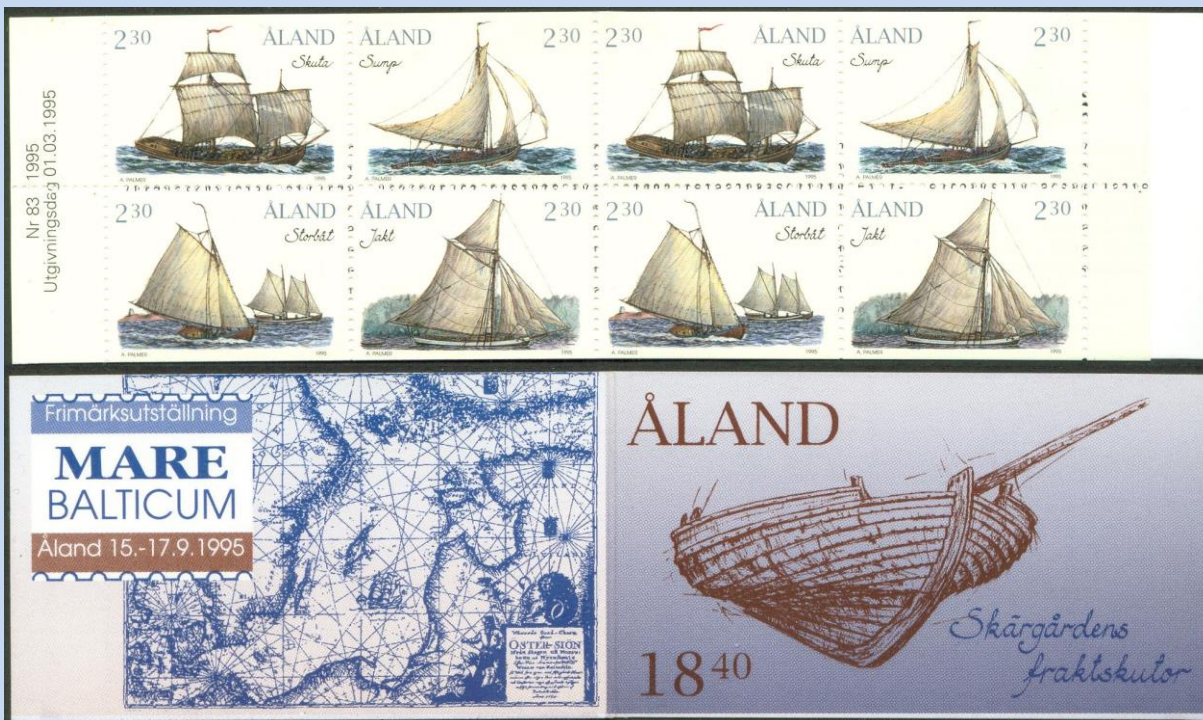
Afbeelding 8. (Een postzegelboekje uitgegeven ter gelegenheid van de postzegel tentoonstelling "Mare Balticum" in 1995. Afgebeeld zijn enkele typen boten waarmee de Ålanders in vroeger tijden handel dreven met de omliggende landen)