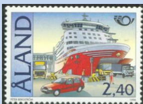
Afbeelding 4. (De passagiers ferry Isabella. Een van de ferry's die de toeristen naar Åland vervoeren)

Dankzij de gunstige ligging heeft deze eilanden groep een grote aantrekkingskracht op de hedendaagse toerist die bij het woord cruise onmiddellijk al aan het pakken slaat.