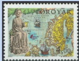
Afbeelding 10. (De beide zegels van Åland en de Føroyar ter ere van St. Olaf. Hij leefde van 995 - 1030 en was koning van Noorwegen van 1016 - 1028)

Op 1 januari 1993 kregen de eilanden nog meer zeggenschap over hun eilanden en werd o.a. de onafhankelijke Ålandse postdienst een feit.