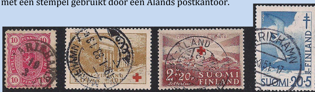
Afbeelding 13. (Een aantal Finse zegels met een Ålands poststempel)

U ziet de geschiedenis van deze eilandengroep is een bewogen geschiedenis waarvan veel terug te vinden is op hun mooie postzegels en vaak prachtig geïllustreerde postwaardestukken. Ook de vele voor- en meelopers van Finland en Zweden geven een extra dimensie aan een verzameling van zegels en posthistorie van dit gebied. Een extra leuke uitdaging is het verzamelen van Finse zegels gebruikt op Åland en ontwaard met een stempel gebruikt door een Ålands postkantoor.