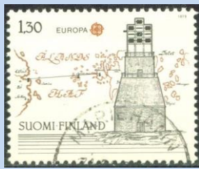
Afbeelding 7. (De optische telegraaf van Signilskår)