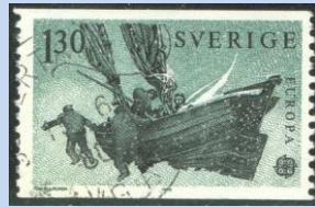
Afbeelding 3b + c. (Een Fins en een Zweeds zegel waarop afgebeeld deze bootjes die meestal voortgetrokken werden door een 5 of 6-tal mannen)

Elk jaar wordt deze postroute in juni herdacht en wel door het houden van een roeiwedstrijd tussen de Ålanders en de bewoners van de Zweedse streek Roslagen waar Grisselehamn ligt.